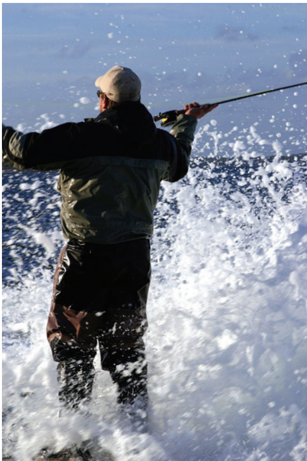
Blåser det?! Ingen fara med sjunklinan!