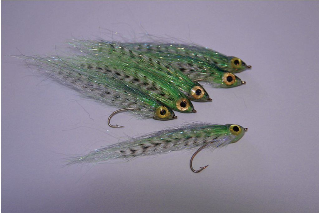
Perfekta till sjunlinefisket!